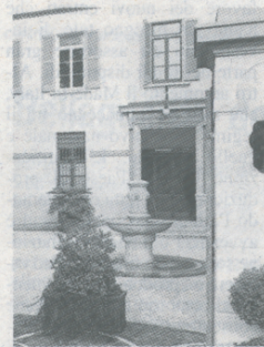
La sede di Alfaomega

La Giornata Mondiale della lotta all'Aids è anche occasione per fare un bilancio della diffusione della patologia. La sezione mantovana di Alfaomega Onlus non rassicura sullo stato di fatto: il numero dei nuovi sieropositivi è stabile, in altre parole non si registra una diminuzione dei contagi dichiarati, mentre si intravede la possibilità di un loro aumento. Il Ministero della Sanità conferma l'improvviso ritorno della patologia causato dal fatto che l'eterosessualità è diventata la via preferita di propagazione del virus. Sono sempre più numerosi i casi di persone che