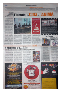
foto della settimana

Preservativi "umani" per ricordare ai mantovani che l'Aids uccide ancora milioni di persone nel mondo. Anche a Mantova, con una media di 35 contagi ogni anno. Avevano promesso un'iniziativa forte i volontari dell'associazione Alfaomega. E sono stati di parola. Lo scorso 1 dicembre, infatti, sette "condom umani" hanno sfilato per il centro storico, da via Roma a piazza Sordello, per richiamare l'attenzione di persone, mass media e istituzioni su questo flagello. L'iniziativa rientra nella Campagna Mondiale organizzata dall'Associazione Internazionale "World Aids Campaign" che quest'anno propone lo slogan "Getting to zero": zero nuove infezioni, zero discriminazioni e zero morti Aids-correlate entro il 2015.